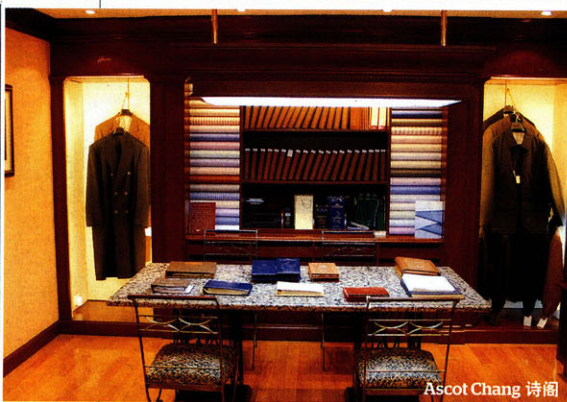
Ascot Chang 诗阁