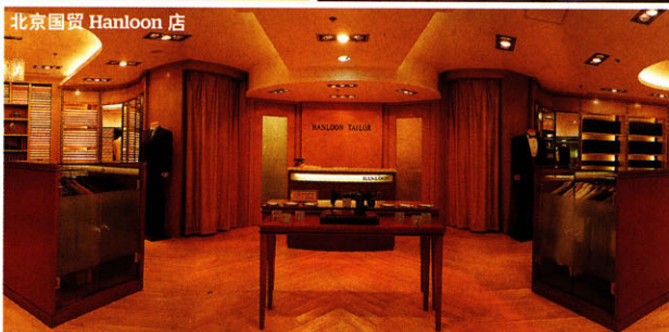
北京国贸 Hanloon 店