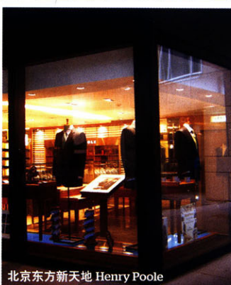
北京东方新天地 Henry Poole